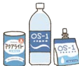
市販の経口補水液